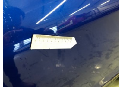
LA portier - Kras(sen)