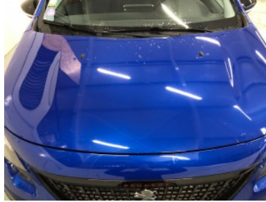
Motorkap - Kras(sen)