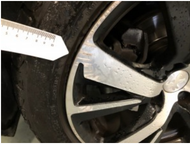
LV velg - Kras(sen)