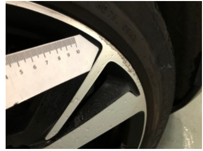
RV velg - Kras(sen)