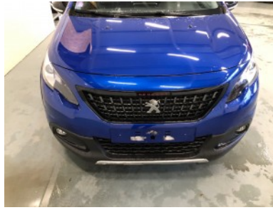
Voorbumper - Kras(sen)