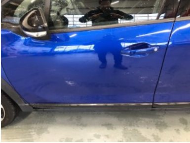
LV portier - Kras(sen)