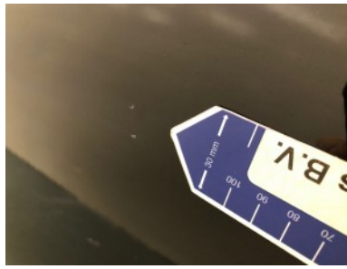
RA portier - Kras(sen)