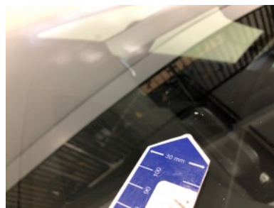
Voorruit - Steenslag