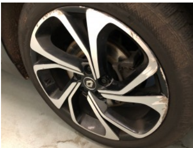
RV velg - Kras(sen)