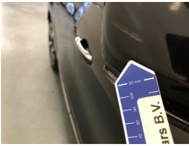
Buitenspiegel rechts - Kras(sen)