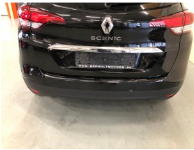
Achterbumper - Deuk(en)