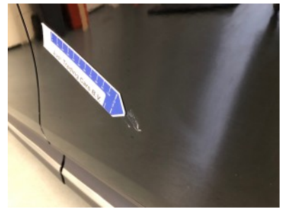
LA portier - Deuk(en)