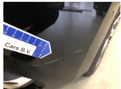
Voorbumper - Kras(sen)