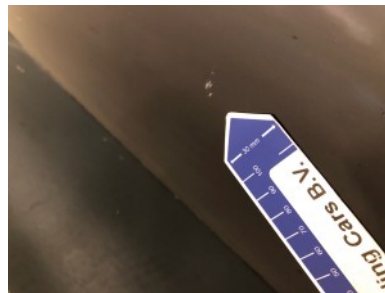
A-Stijl rechts - Kras(sen)