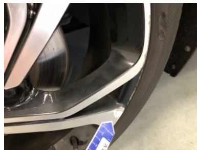
LV velg - Kras(sen)