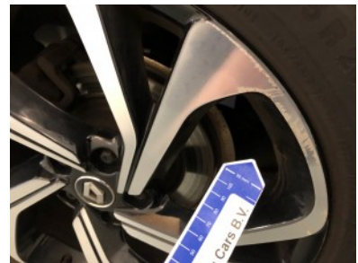
RA velg - Kras(sen)