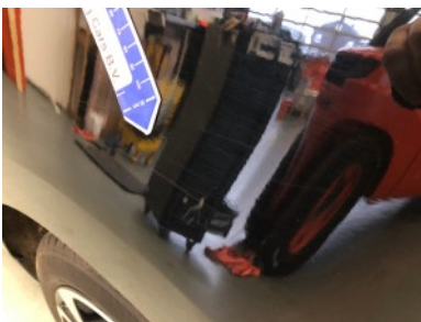
LA scherm - Kras(sen)