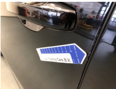
LV portier - Kras(sen)