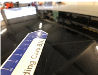
Dak - Deuk(en)