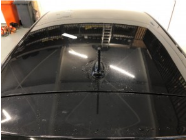
Dak - Hagelschade