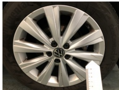
RV velg - Kras(sen)