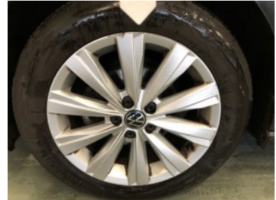
LV velg - Kras(sen)