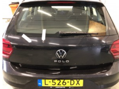
Achterklep/deksel - Restyle Deukje(s)