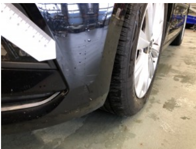
Voorbumper - Kras(sen)