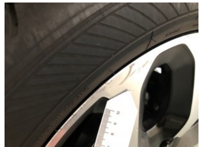
RV velg - Kras(sen)