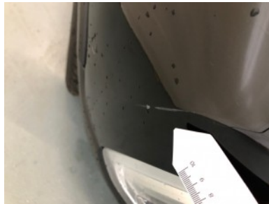
Voorbumper - Kras(sen)