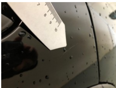
RA scherm - Kras(sen)