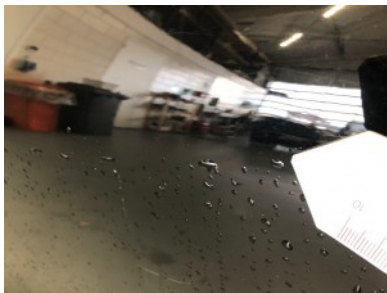
LV portier - Restyle Deukje(s)