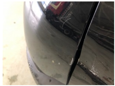
Achterbumper - Deuk(en)