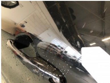
LV portier - Kras(sen)