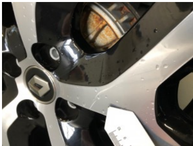
LA velg - Kras(sen)