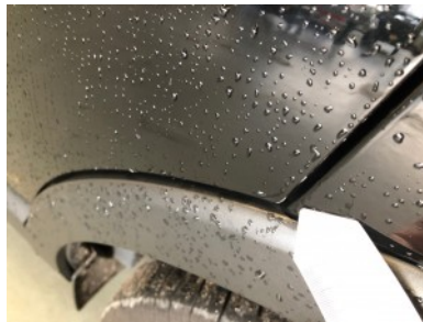
LA portier - Kras(sen)