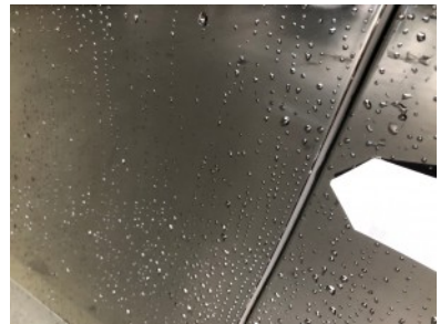
LV portier - Kras(sen)