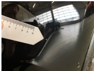
Voorbumper - Steenslag