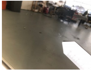
LV portier - Kras(sen)