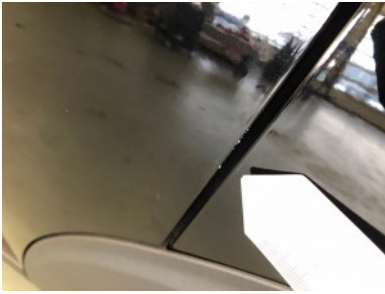
LA portier - Kras(sen)