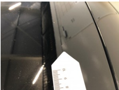
Motorkap - Steenslag