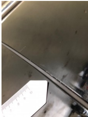
LV portier - Kras(sen)