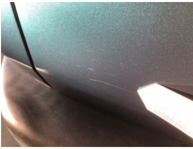
Achterklep/deksel - Kras(sen)