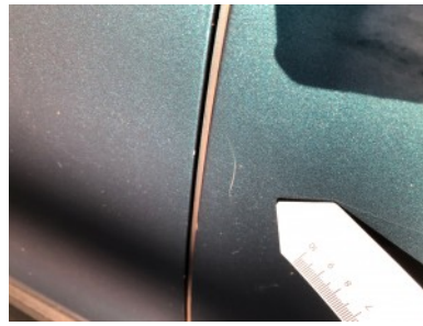
LA portier - Kras(sen)