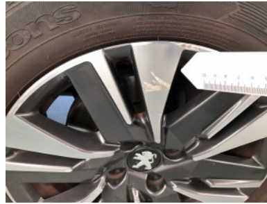
RV velg - Kras(sen)