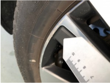
RA velg - Kras(sen)