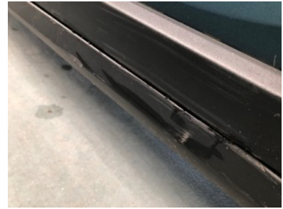
Dorpel rechts - Kras(sen)