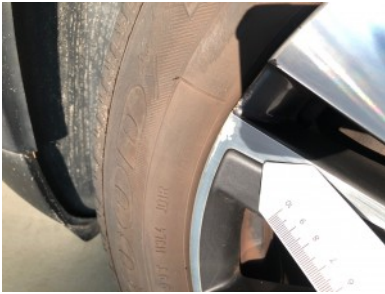
LV velg - Kras(sen)