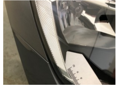
Koplamp rechts - Kras(sen)