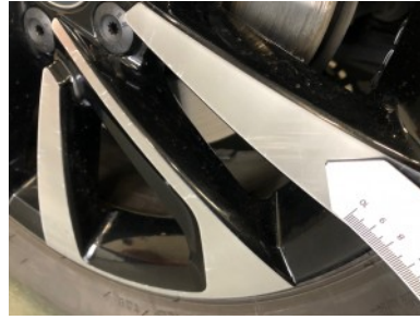
LV velg - Kras(sen)