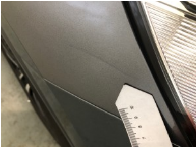
RV scherm - Deuk(en)