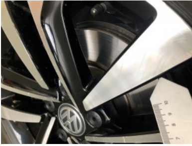
LV velg - Kras(sen)