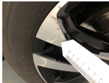
RV velg - Kras(sen)