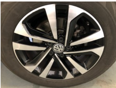
RV velg - Kras(sen)