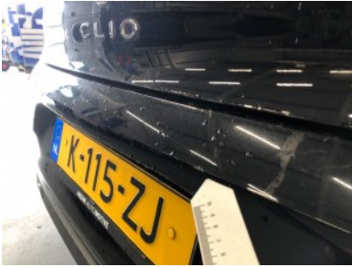
Achterbumper - Kras(sen)