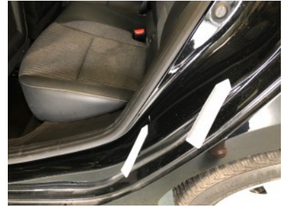
LA portier - Restyle Deukje(s)