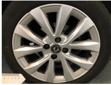
RV velg - Kras(sen)