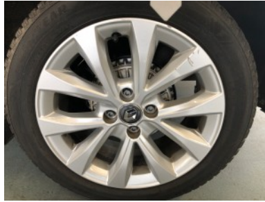
LA velg - Kras(sen)