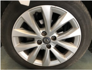
LV velg - Kras(sen)