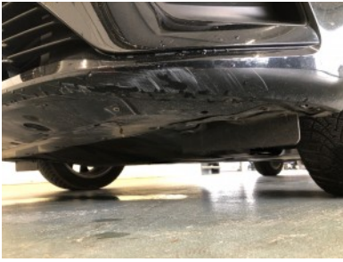
Voorbumper - Kras(sen)