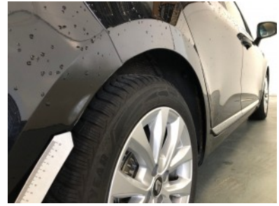
Achterbumper - Kras(sen)