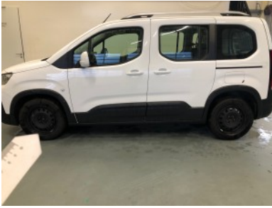
Wieldoppen Linkerzijde Manco (2X)