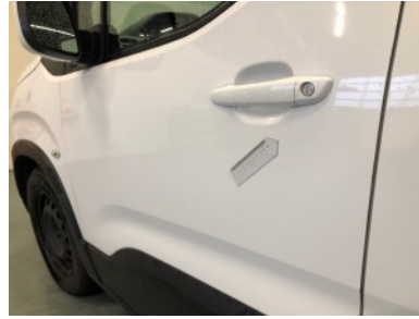
LV portier - Restyle Deukje(s)