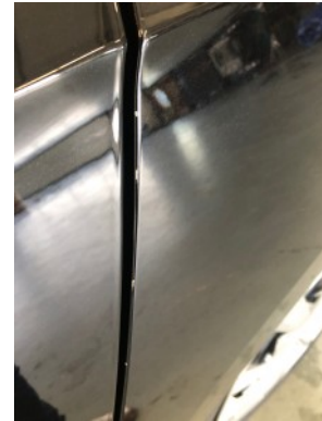
LA scherm - Steenslag