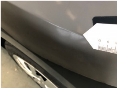
RV scherm - Restyle Deukje(s)