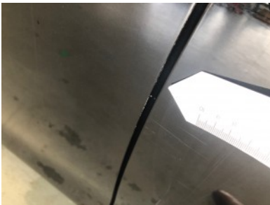
LV portier - Kras(sen)