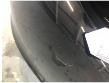
Achterbumper - Kras(sen)