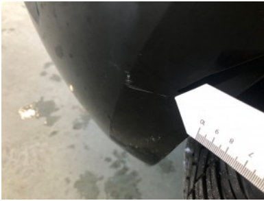
Achterbumper - Kras(sen)