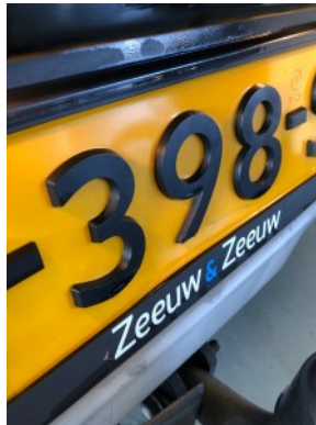
Achterbumper - Deuk(en)