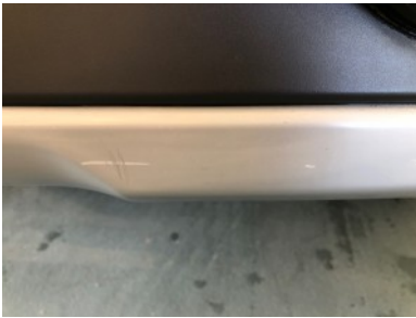
Achterbumper - Kras(sen)