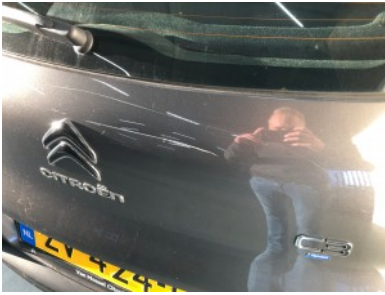
Achterklep/deksel - Kras(sen)