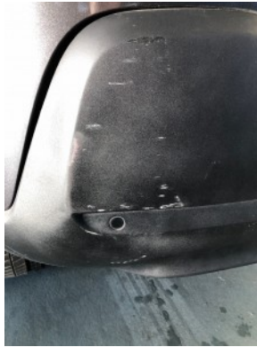
Achterbumper - Kras(sen)